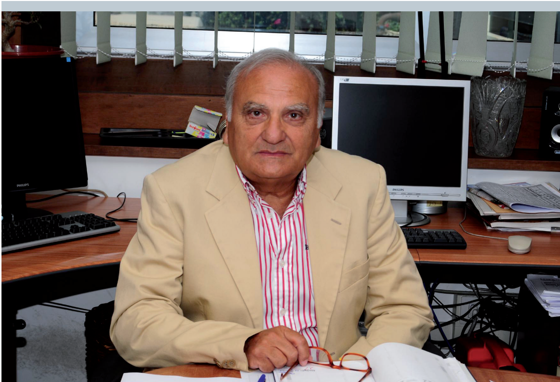
Vicedirettore del quotidiano "La Sicilia"