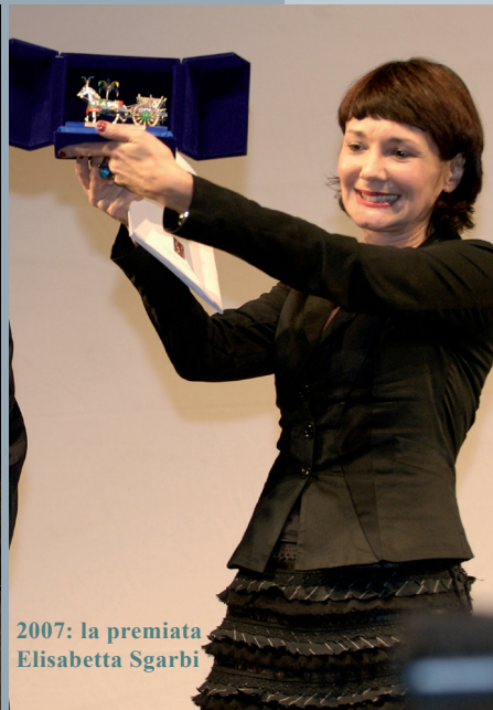
2007: la premiata Elisabetta Sgarbi